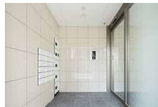
高級感あふれるエントランス。 防犯性の高いオートロックマンション。