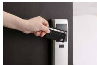
ピッキングに強いICカードキー。