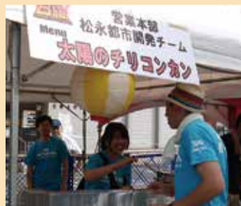
◀目的に向かって全員がまとまるときは、いい笑顔が弾ける。(岩槻まつりより)

そんなことを一人ひとりが考え実行すれば、きっと大きな推進力が生まれるはず。全社員での「知恵と工夫のオール漕ぎ」、期待して下さい。