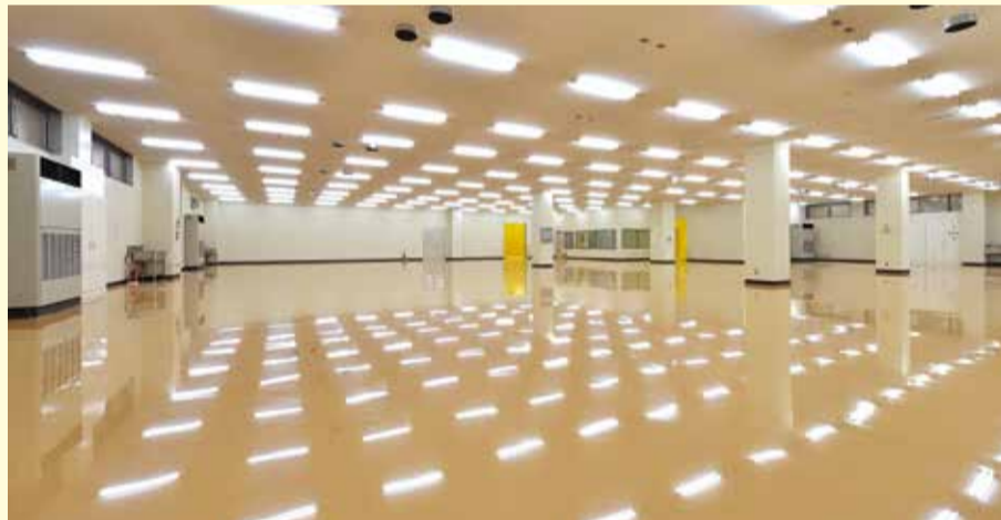
▲大型かつデリケートな印刷機械が並ぶことになる大空間構造の1階。紙とその圧着商品を扱うアンビエな仕事環境上、当センターには湿度コントロールのできるミストが導入された

様々な仕様で作成可能な封書サイズのDMツール。 定形サイズ(最大120mm×235mm)までであれば、 全て郵便料金80円の範囲内です。