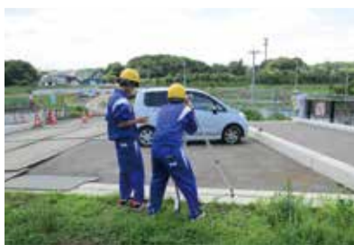
▲社会貢献として地元中学生の職業体験も当現場で受け入れた。未来の人材育成へとつながる大きな役割