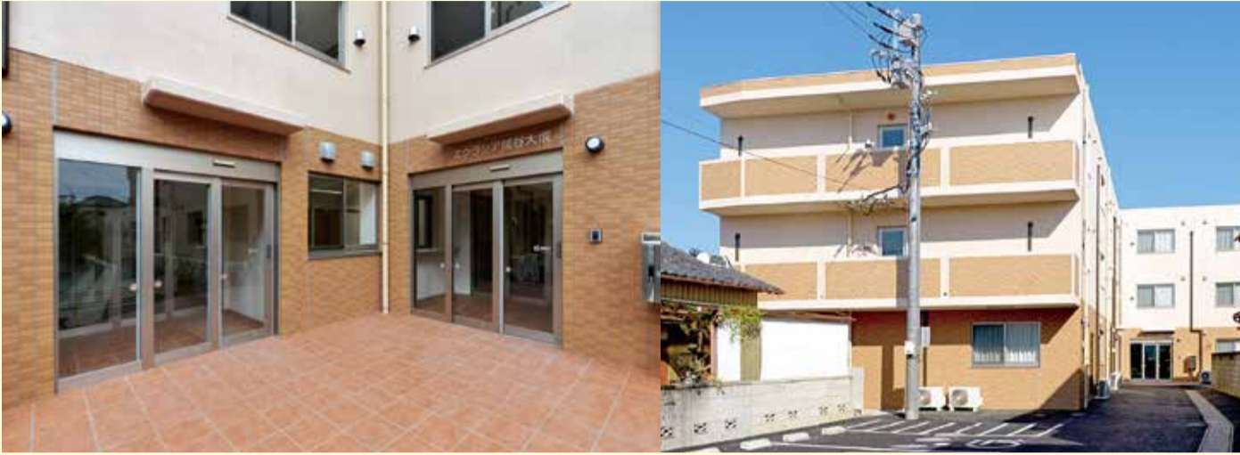
▲高齢者に居住・生活空間を提供するだけでなく、介護機関や医療機関との連携で複合的なサービスを目指す「エクラシア越谷大成」。早くも満室が見込まれている