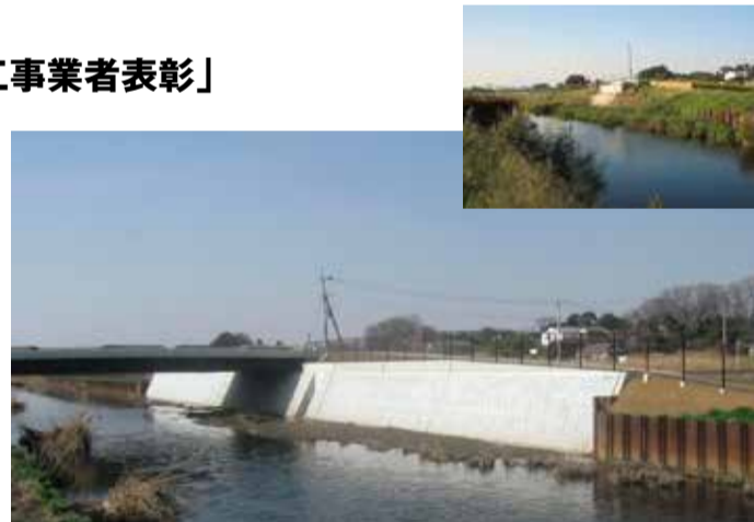
▲橋架もかかり、全工程が終了した加田屋橋。施工前(写真右)と比べると強度差は歴然

そうです。表彰を受けた2件の工事のキーワードが、共にコミュニケーション力と提案力であったことは決して偶然ではありません。お客様に感動を差し上げたいという一心で突き進む「感動創造建設会社」の面目躍如たる結果といっても過言ではないでしょうか。