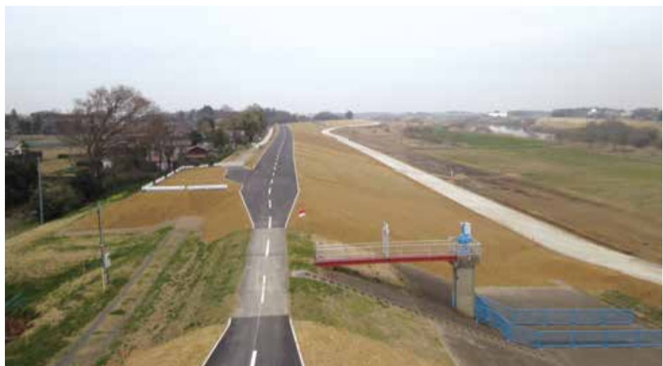
▲工事完了後の現場全景、総長700mを一気に仕上げる工事だった。土手を右手方向に下ったところに白く通っているのが緊急河川敷道路、堤防の中を横切るように設置されているのが用水を通す樋管

ること、どうすれば円滑に工事が回るかにひたすら心を砕くこと、この2点を大事にしているだけです」