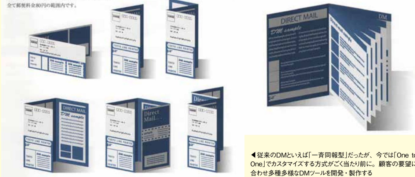
◀従来のDMといえば「一斉同報型」だったが、今では「One to One」でカスタマイズする方式がごく当たり前に。顧客の要望に合わせ多種多様なDMツールを開発・製作する

様々な仕様で作成可能な封書サイズのDMツール。 定形サイズ(最大120mm×235mm)までであれば、 全て郵便料金80円の範囲内です。