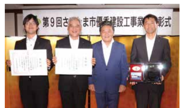
▲さいたま市浦和区のとときわ会館で行われた表彰式当日の様子

引き続き2面でも、各工事の詳細と施工において努めた創意工夫等についてお伝えしましょう。