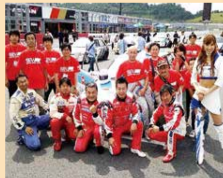
◀7時間の奮闘とい汗が思い出となった「もてぎEnjoy耐久レース」でのひとコマ

私たちは皆、松永建設グループという同じ船に乗る者同士。もちろん豪華客船ではありませんから、みんなでオールを漕がなければ1cmだって前には進みません。どのポジションで、どのく