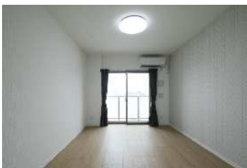
南西向き of 暖かいお部屋です。