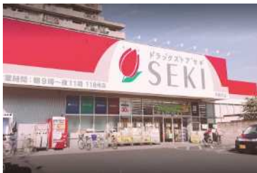
■ ドラッグストア (徒歩 7分) ドラッグストアセキ大成町店