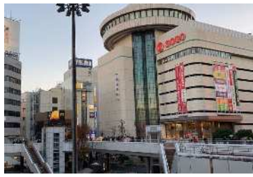
■ 百貨店 (徒歩 14分) そごう大宮店