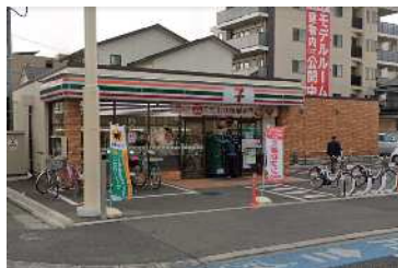
■ コンビニエンスストア (徒歩 4分) セブンイレブンさいたま大成町2丁目店