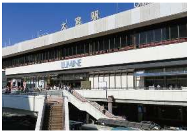
■ 駅 (徒歩 12分) JR「大宮駅」西口