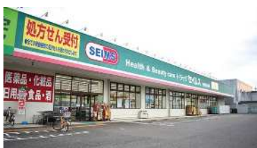
■ ドラッグストア (徒歩 5分) ドラッグセイムス与野鈴谷店