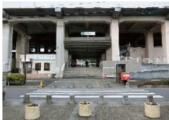
■ 駅 (徒歩 14分) JR「南与野駅」西口