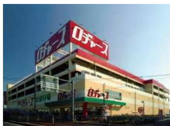
■ ディスカウントストア (徒歩 3分) ロチャース浦和店