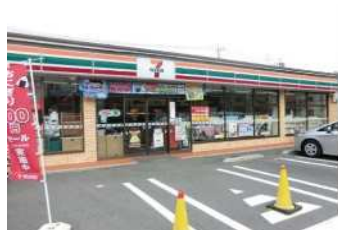
■ コンビニエンスストア (徒歩 8分) セブンイレブンさいたま鈴谷4丁目店