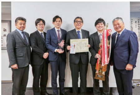
最優秀部門賞（MVT）の表彰