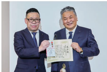
最優秀個人賞（MVP）の表彰

そのほか、弊社は「健康経営優良法人」認定企業として社員の健康促進のための習慣づくりをサポートしており、その一環として同会で「ウォーキングラリー表彰式」も開催。日々の平均歩数の上昇率などをチームで競い、その成果を大いに表彰しました。本年も弊社は「企業は人なり」の企業理念のもと、全社一丸となって邁進してまいります。