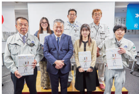
ウォーキングラリー表彰